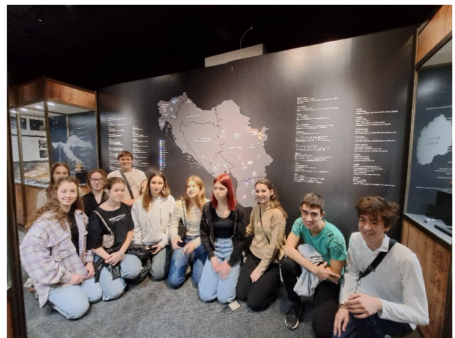
Ученици 2/11 у Галерији на изложби Минерална блага Југославије, примерци из поклон збирке Јосипа Броза Тита